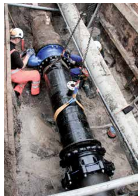
Einbau der Armatur mit Pass-Stück