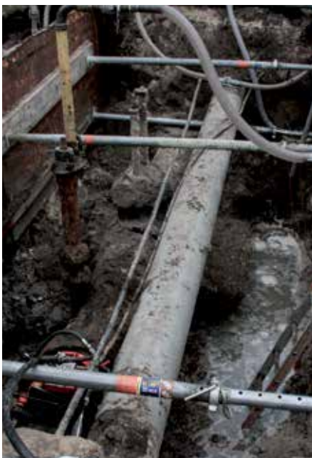
Kopfloch mit alter Armatur

seits sollte der FRIAGRIP Flanschadapter DN500 zur Anbindung an das bestehende Gussrohr zum Einsatz kommen.