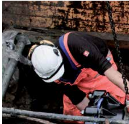
Einfädeln des FRIAGRIP Flanschadapters