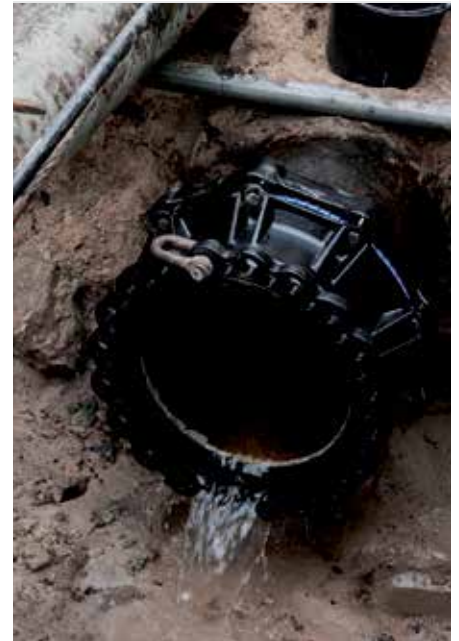
Positionieren des FRIAGRIP Flanschadapters

Das Dichtungspaket der FRIAGRIP Bauteile >DN400 ist werksseitig vormontiert und durch die Gehäusekomponenten so gekammert, dass beim Einfädeln des Bauteils die Dichtungen mit der Stirnfläche des Rohres nicht in