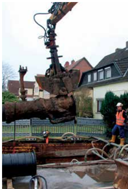
Ausbau der alten Armatur